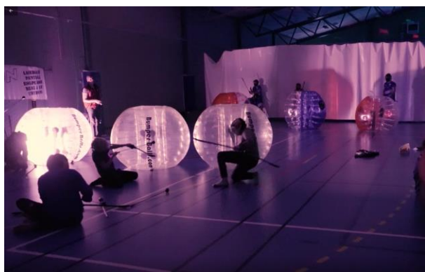
Funzone med aktiviteter