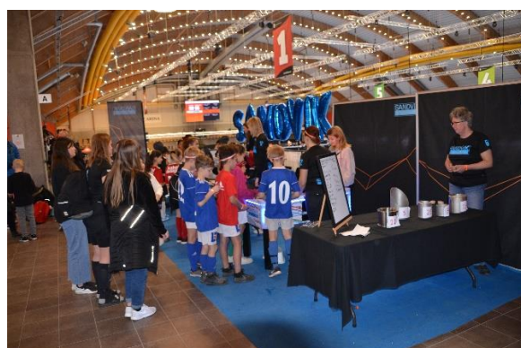
Tekniska utmaningar i arenan