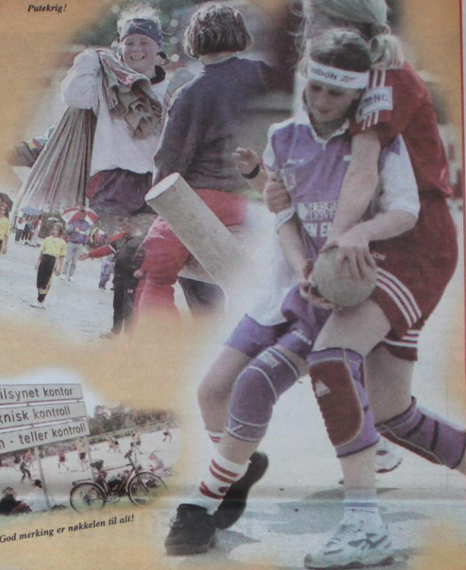
«Tøffe tak på banen!»