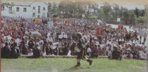
Oppstilling av spente deltakarar før defilering på Leirvik skule.