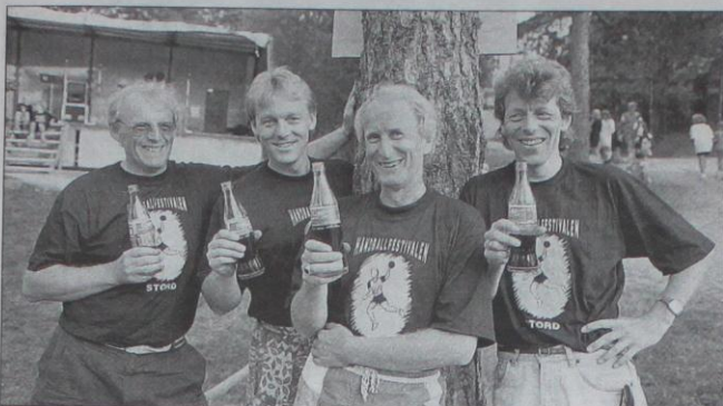
Tida går - Chiclets held fram!