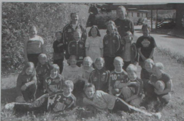
Solid 19G10 er klare for handballfest

Breiddeklubb Solid har ein klar profil på å vera ein breiddeklubb opp til 15 år. Dei som vil satsa kan gå til Stord etter det. Men me vil og prøve å gjø tilbod til 16- og 17-åringar om dei vel å bli her ute.