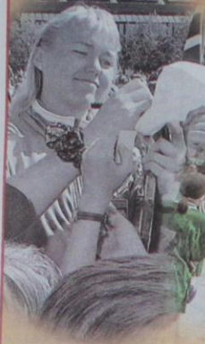
Hyggeleg at kjenntfolk stikk innom.