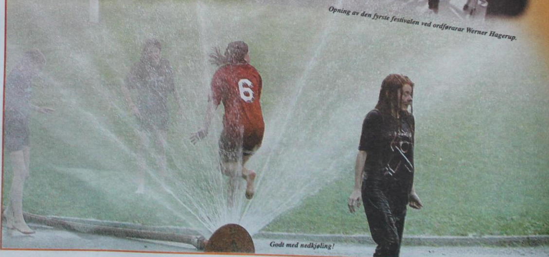
Godt med nedkjøling!