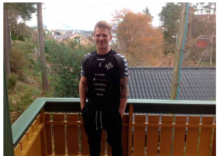
Dei siste åra har det blitt lite handball på den skadefølgde finnen.

No legg eg inn ekstra treningar i sommar for å stå best mogeleg rusta til neste sesong i Finland.