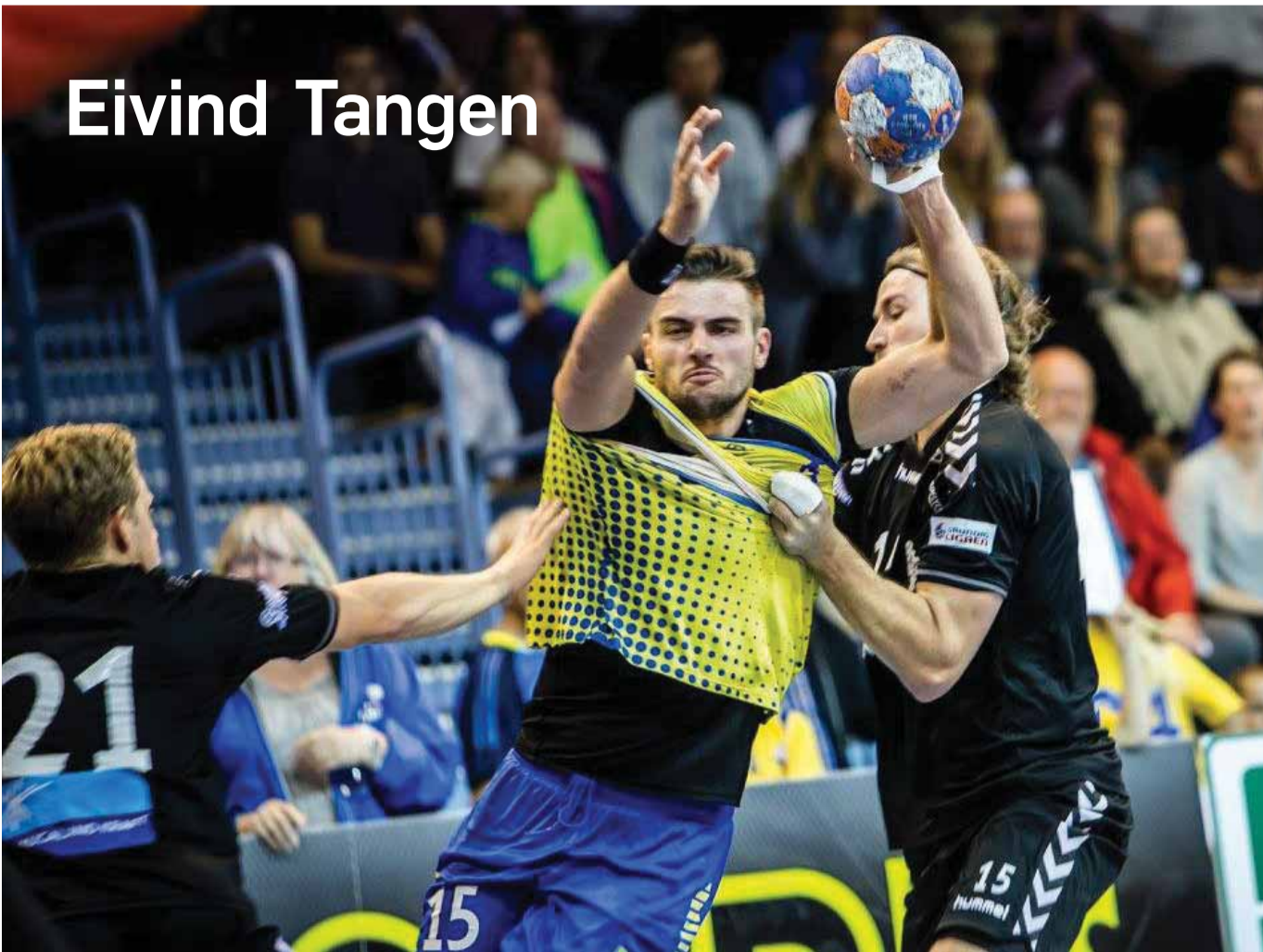
Typisk Tangen. Satsar alt i tøff duell.